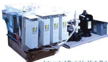
Integrated Portable High-Rate Water Processing System